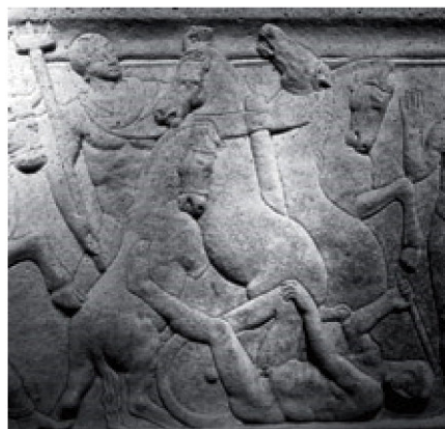
Morte d'Ippolito, dettaglio del retro di un sarcofago attico col mito di Fedra e Ippolito, marmo del Pentelico, 230-250. Tarragona, Museo Arqueológico (Paolo Moreno, Roma)