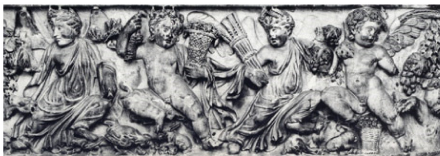
Copie di Amore e Psiche con i simboli delle Stagioni, dettaglio della fronte di un sarcofago di produzione urbana, marmo di Luni, 230-240. Roma, Palazzo dei Conservatori

Un sorprendente paragone scaturisce dalla contemporaneità di due mostre indipendenti e lontane, bensì accomunate dall'alta qualità dei pezzi e dall'impegno dei responsabili, eroico in tempi calamitosi per la cultura: Caravaggio (Roma, Scuderie del Quirinale, fino al 13 giugno) e Gli arazzi dei Gonzaga nel Rinascimento (Mantova, Palazzo Te, Palazzo Ducale e Museo Diocesano, fino al 27 giugno 2010). L' Amore vincitore , dipinto in Roma dal Merisi il 1602 per Vincenzo Giustiniani, viene considerato in catalogo da Bernd Wolfgang Lindemann una parafrasi dal San Bartolomeo di Michelangelo, dolente autoritratto del maestro nel Giudizio alla Sistina, al quale sarebbe stata ridonata nella tela "una condizione di giovinezza e vitalità". Possiamo tuttavia constatare che la freschezza dell'adolescenza, insieme all'irritante posa del soggetto mitico, erano nel precedente patrimonio visivo del Caravaggio a Milano. Tra gli arazzi donati da Guglielmo Gonzaga a Carlo Borromeo, e dal cardinale assegnati al Duomo nel 1569, c'erano i Puttini con l'arme Gonzaga , dove il Cupido già stava a gambe divaricate, il braccio destro allargato e la testa piegata a sinistra.