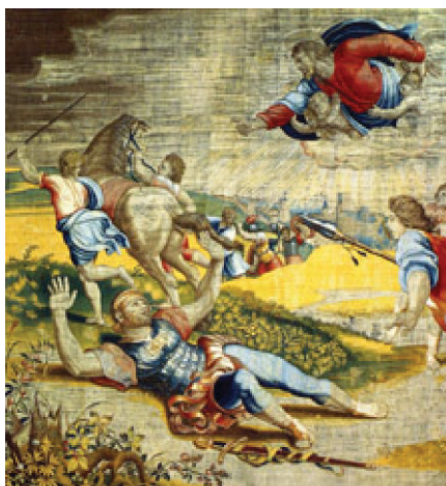
Conversione di San Paolo, dettaglio, arazzo della bottega di Jan van Tieghem, Bruxelles, prima del 1557. Mantova, Museo di Palazzo Ducale

Ancora una volta sono i sarcofagi che offrono il preludio classico al prodigio di Damasco: nel dramma d'Ippolito, precipitato dal carro per volontà di Posidone, appare il caduto supino sulla riva di Trezene coi cavalli incumbenti e il dio dal fondo.