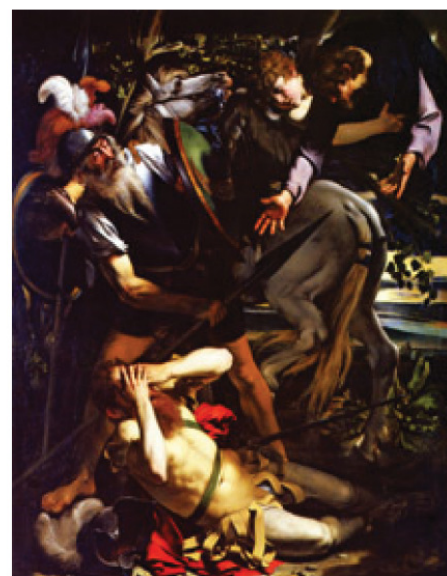
Conversione di Saulo , olio su tela del Caravaggio, 1600-1601. Collezione privata, Roma